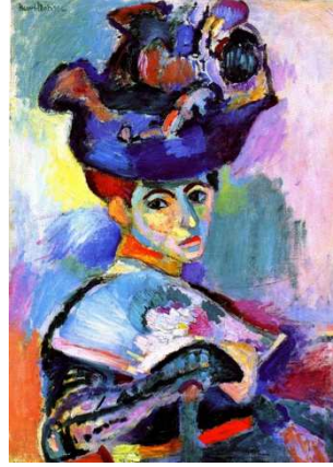
3B. H. Matisse: Mujer con sombrero . 1905.

4. Compare y relacione las técnicas y lenguajes de estas dos obras (similitudes y diferencias). (4 puntos máximo).