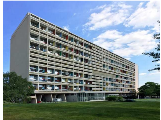
4B. Le Corbusier: Unité d'Habitation.