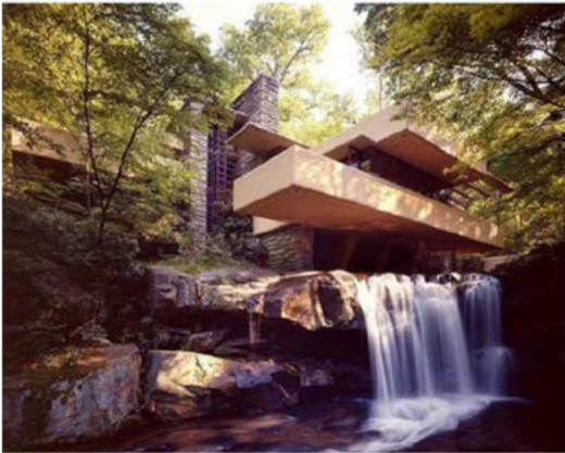
4A. F.L. Wright: La Casa de la cascada.

4. Compare y relacione las técnicas y lenguajes de estas dos obras (similitudes y diferencias). (4 puntos máximo).